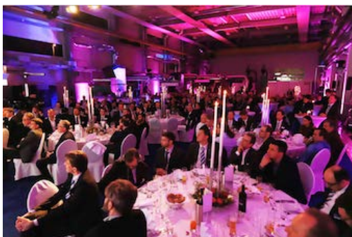
Opening Event am Vorabend des EREMA "Discovery Day 2015"