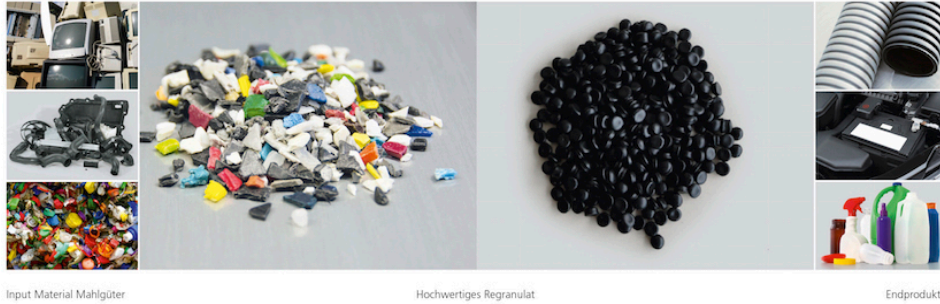
Die neue INTAREMA® RegrindPro® Technologie

Das Resultat der neuen INTAREMA® RegrindPro® Recyclingtechnologie für Mahlgüter ist eine maximale Granulatqualität für maximalen Rezyklatanteil im neuen Endprodukt.