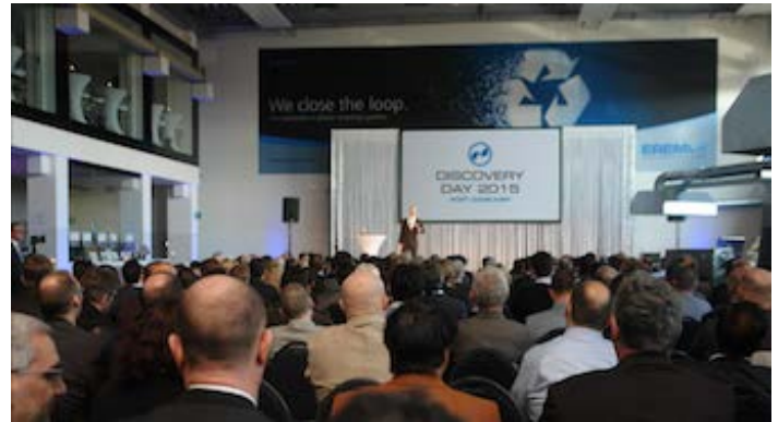
EREMA „Discovery Day 2015“ Post Consumer

Am 20. März 2015 fand in der EREMA Firmenzentrale in Ansfelden, Österreich, ein weiterer Event der erfolgreichen Veranstaltungsreihe "EREMA Discovery Day" statt. Mehr als 200 Kunden, Interessenten und Gäste folgten der Einladung und profitierten dieses Mal von Informationen über Trends, Herausforderungen, Chancen und effiziente Lösungen zum Thema Post Consumer Recycling. Das Highlight des "Discovery Day 2015" stellte die weltweite Premiere der Produktneuheit INTAREMA ® RegrindPro ® für hocheffizientes Recycling von Mahlgütern dar.