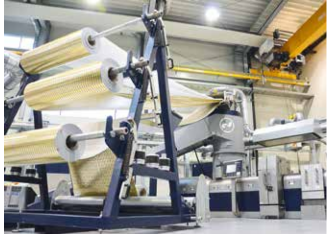
Anhand der Intarema TVEplus im Erema Customer Centre werden Rezyklate exakt auf die Kundenwünsche hin angepasst

Informationstechnologien, stehen in keinem Widerspruch zueinander. Auch die Kunststoffbranche kann Industrie 4.0 für sich nutzen: Angefangen von technischen Optimierungsprozessen bis hin zu Qualitätskontrollen. Der vorhin angesprochene Kunststoffkreislauf kann digital begleitet werden, was die Transparenz signifikant erhöht.