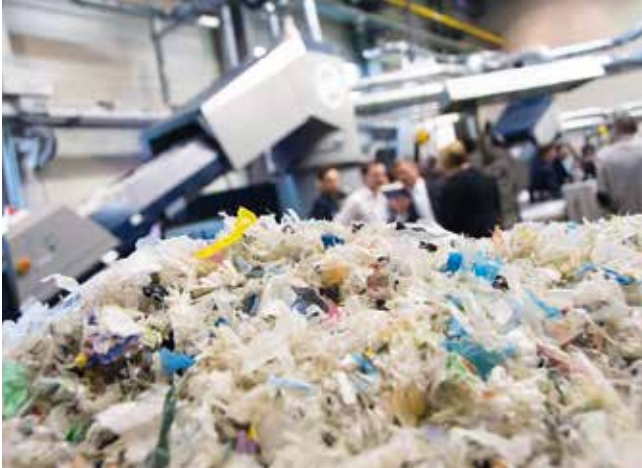
PE-Waschnitzel: Rohstoff der Zukunft für Materialhersteller